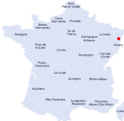
Ici plan plus précis